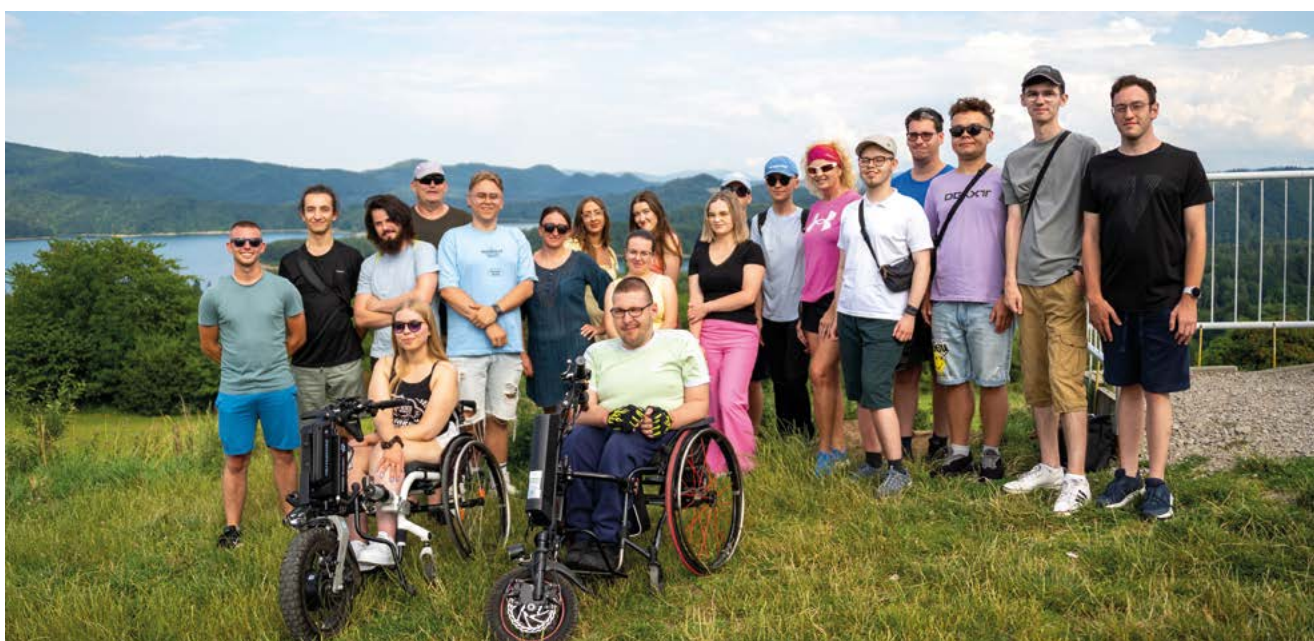
Obóz letni BON Polańczyk 2025