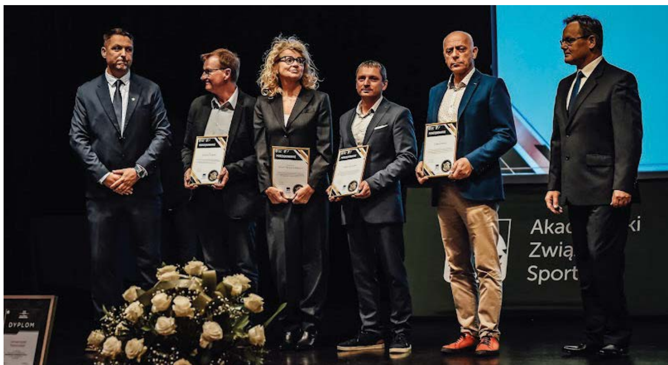
Gala Jubileuszowa z okazji 60-lecia Klubu Uczelnianego AZS UR

SZACHY – 8–10.10.2021 r., Dąbrowa Górnicza 1 srebrny medal i II miejsce w klasyfikacji drużynowej