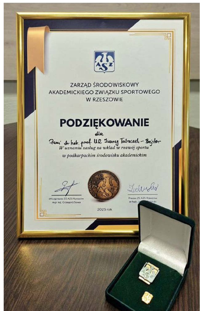
Gala Sportu AZS 2025