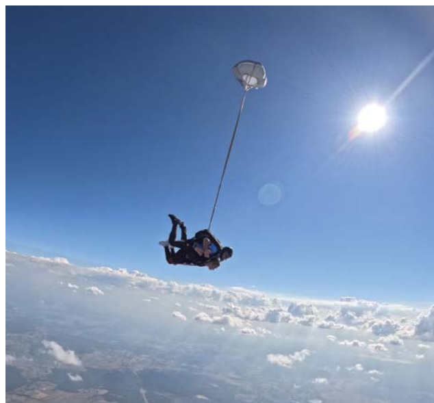
Źródło: Ewa Marszałek

Studiuję na uczelni, która otacza wsparciem osoby z niepełnosprawnościami. Dzięki pomocy Biura ds. Osób z Niepełnosprawnościami UR mam możliwość rozwijania się nie tylko naukowo, ale też sportowo. Jedną z takich rzeczy są zajęcia z pływania organizowane właśnie przez Biuro. Pływanie stało się dla mnie nie tylko formą rehabilitacji, ale też pasją, która daje mi ogromną radość i poczucie wolności. Poza zajęciami na uczelni biorę też udział w obozach sportowych z myślą o osobach z niepełnosprawnościami. To wydarzenia, które łączą w sobie aktywność fizyczną, integrację i ogromną dawkę pozytywnej energii. Na takich obozach poznaję cudownych ludzi – ciekawych i pełnych pasji.