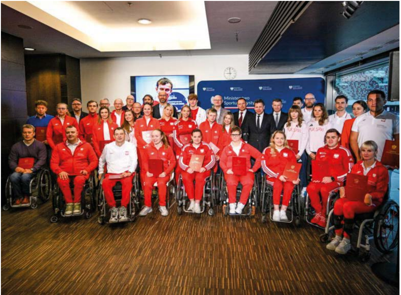
Spotkanie medalistów z ministrem sportu na PGE Narodowym.

ce – ocenił trener Zbigniew Lewkowicz, który w Starcie Gorzów Wlkp. opiekuje się sześciorgiem spośród medalistów.