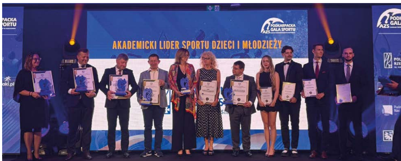
Gala Sportu AZS 2025

Nie zabrakło również specjalnych tytułów i wyróżnień przyznanych w następujących kategoriach dla instytucji i partnerów wspierających AZS: