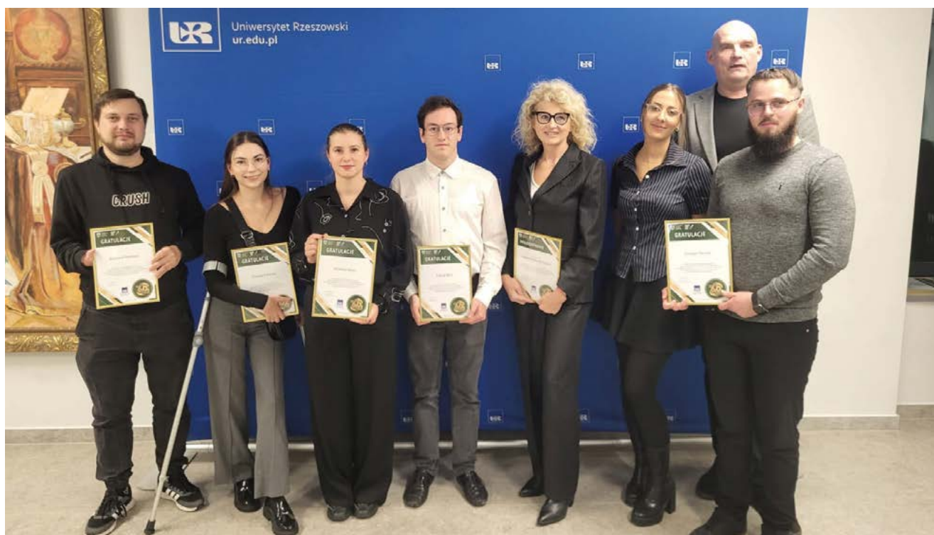
Gala Jubileuszowa z okazji 60-lecia Klubu Uczelnianego AZS UR