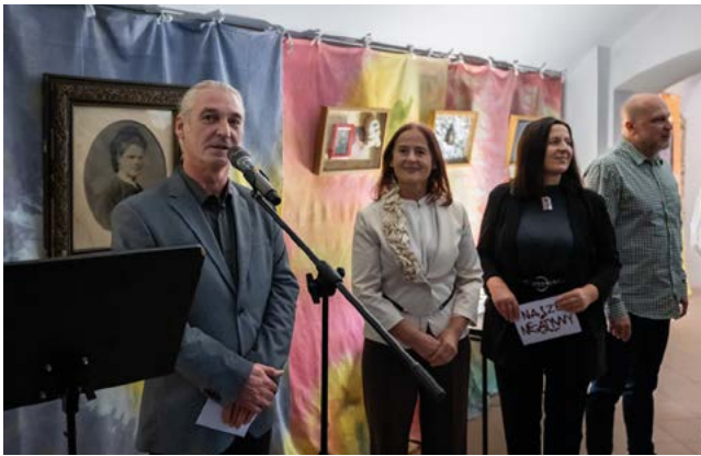
Wystawa Instalacji Multimedialnej NASZE NEGATYWY

niem niepełnosprawności psychicznej i wykluczenia społecznego oraz o sposobach radzenia sobie w różnych sytuacjach kryzysowych. Tłem dla tych poruszających opowieści były wizualizacje sensoryczne i animacje poklatkowe stworzone przez uczestników zadania publicznego.