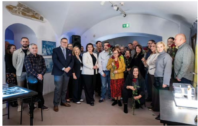
Wystawa Instalacji Multimedialnej NASZE NEGATYWY

Wystawa Instalacji Multimedialnej NASZE NEGATYWY 17.10.2025 – 9.11.2025 Galeria pod Ratuszem ul. Rynek 1, 35-064 Rzeszów