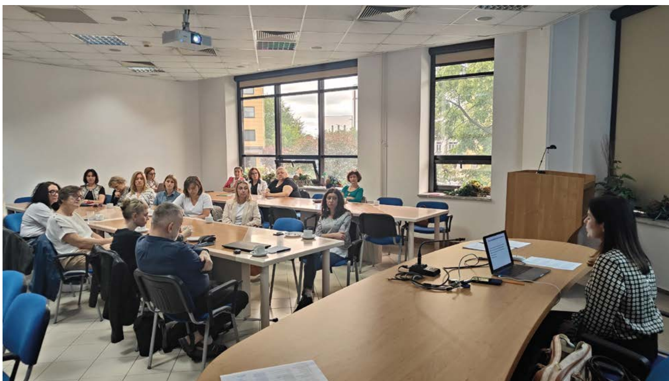
II edycja warsztatów

ryka się z kryzysami zdrowia psychicznego, które dotyczą dzieci, młodzież i dorosłych. W odpowiedzi na rosnącą liczbę studentów z potrzebami wynikającymi z neuroróżnorodności (m.in. ze spektrum autyzmu, ADHD, ADD, dysleksji) i trudności w obszarze zdrowia psychicznego Biuro ds. Osób z Niepełnosprawnościami organi-