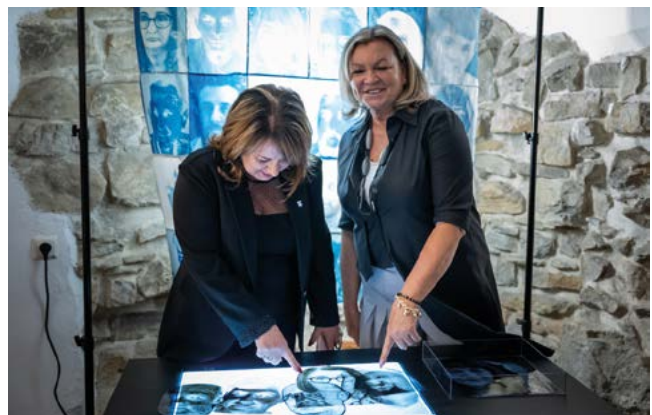
Wystawa Instalacji Multimedialnej NASZE NEGATYWY