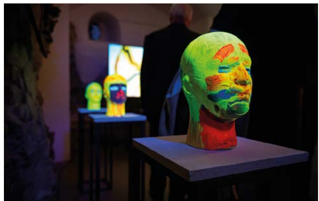
Wystawa Instalacji Multimedialnej NASZE NEGATYWY