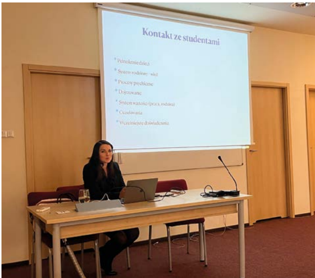
III edycja warsztatów

uje cyklicznie szkolenie pn. „Zrozumieć i wesprzeć. Wyzwania w pracy wykładowcy: Jak radzić sobie z trudnymi zachowaniami studentów wynikającymi z ich problemów psychicznych?” Szkolenie to jest skierowane do wszystkich pracowników Uniwersytetu Rzeszowskiego, a w szczególności do kadry akademickiej UR. Głównym celem szkolenia jest przekazanie ich uczestnikom pod-