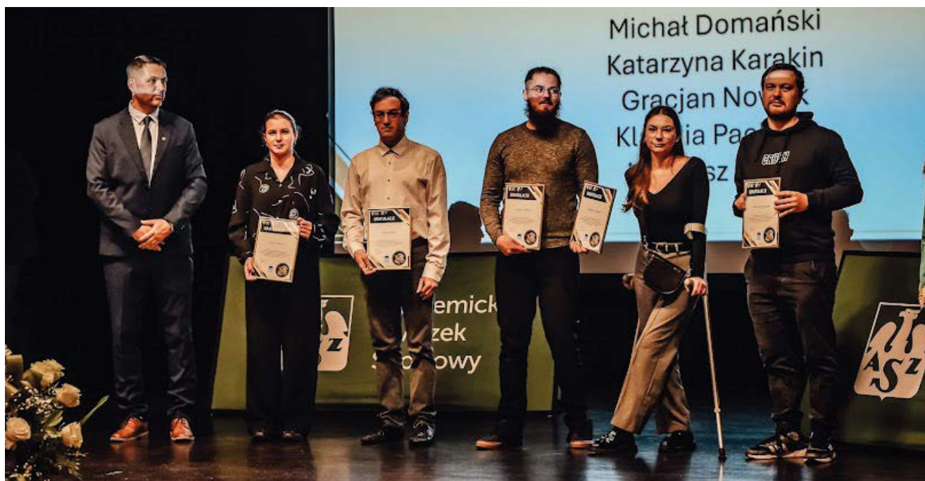
Gala Jubileuszowa z okazji 60-lecia Klubu Uczelnianego AZS UR

Podczas Integracyjnych Mistrzostw Polski AZS reprezentanci UR zdobyli 61 medali , w tym 22 złote, 22 srebrne i 17 brązowych . Startowali w następujących dyscyplinach: pływaniu, tenisie stołowym, szachach, bilardzie i bowlingu, bocci, narciarstwie zjazdowym oraz badmintonie. Najwięcej medali studenci wywalczyli w pływaniu.