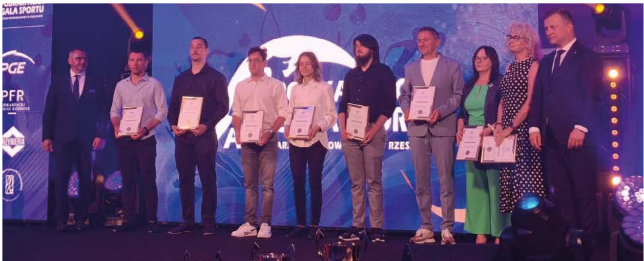
Gala Sportu AZS 2025