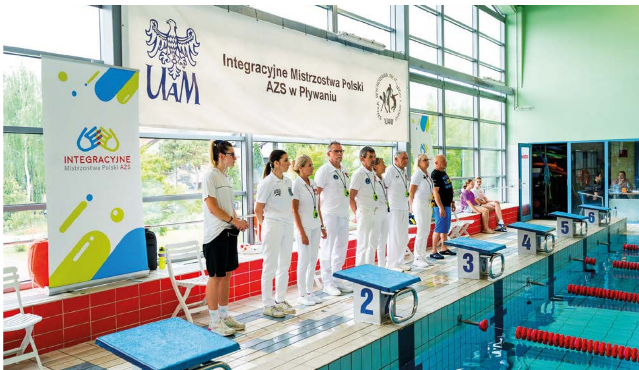
Integracyjne Mistrzostwa Polski AZS w pływaniu, Poznań 2025

Polski AZS w Pływaniu. W zawodach wzięli udział studenci reprezentujący kluby AZS z 23 uczelni w Polsce.