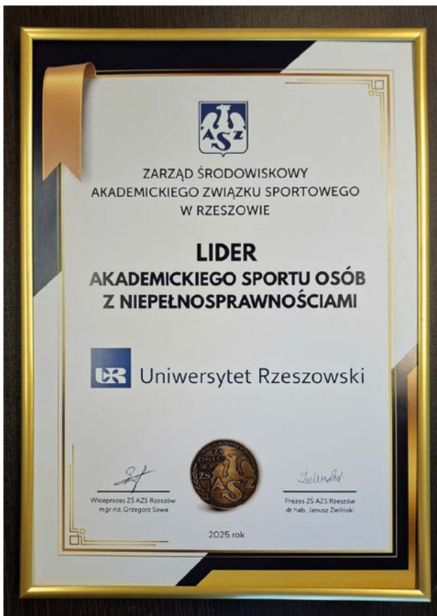
Gala Sportu AZS 2025