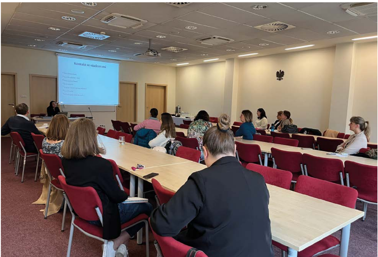
III edycja warsztatów

W 2025 roku zrealizowane zostały trzy edycje ww. szkolenia, które organizowane są przez Biuro ds. Osób z Niepełnosprawnościami w sposób cykliczny. Dlatego zachęcamy wszystkich pracowników, zwłaszcza nauczycieli akademickich, do skorzystania z możliwości pogłębienia wiedzy, która przekłada się na lepsze zrozumienie studentów z problemami natury psychicznej i neuro-różnorodnością, dzwoniąc pod nr: 17 872 10 31 lub pisząc maila na adres: bon@ur.edu.pl