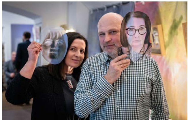
Wystawa Instalacji Multimedialnej NASZE NEGATYWY